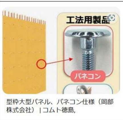
型枠大型パネル、パネコン仕様（岡部株式会社） | コムト徳島